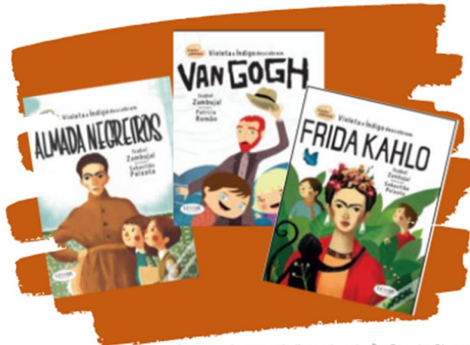
Imagens de capas de livros da coleção Grandes Pintores